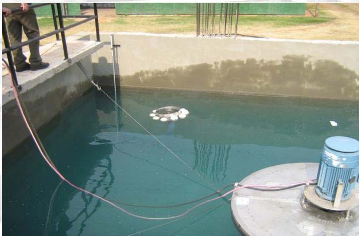
Salemma Planta de Tratamiento de Efluentes