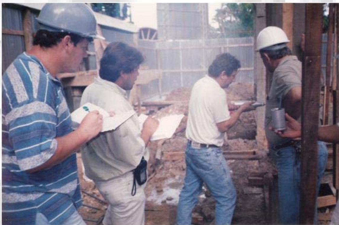
Personal Técnico PLANOBRA S.R.L.