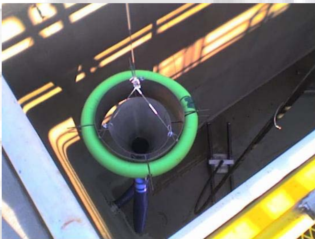
Chortitzer Komitee Planta de Tratamientos de Efluentes