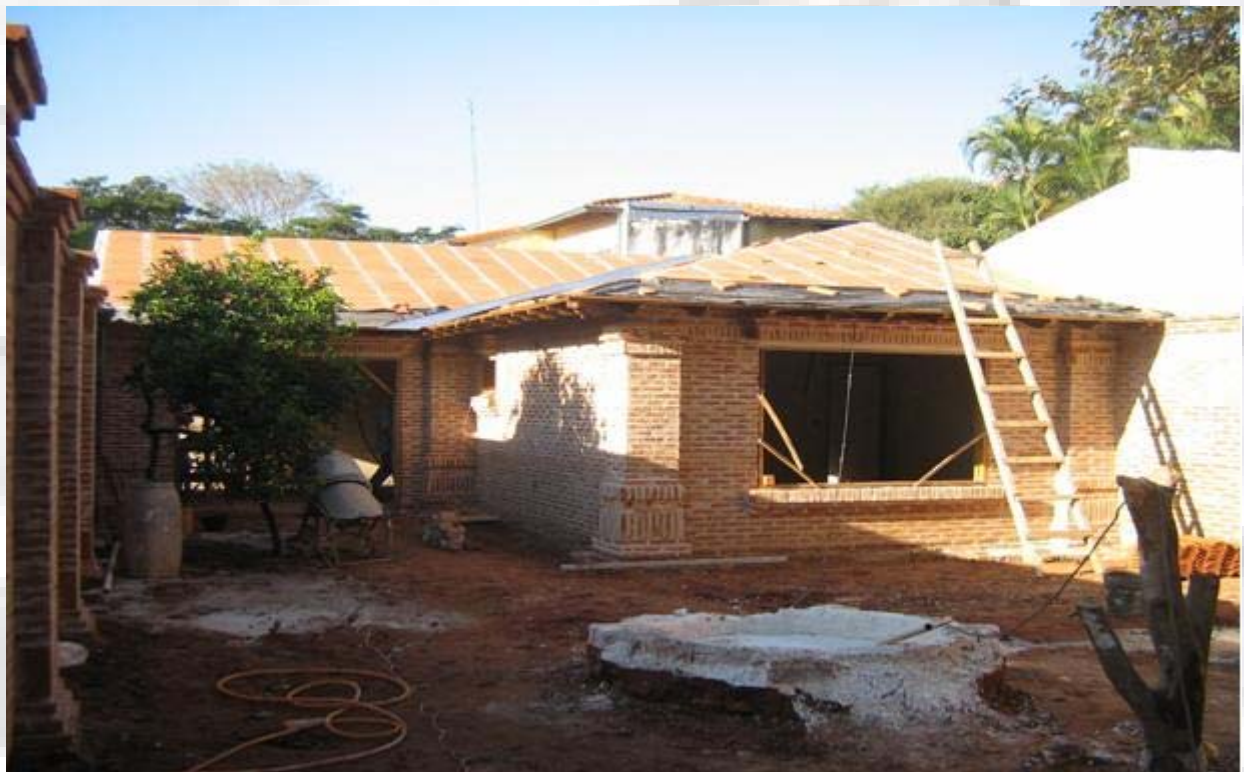
Ampliación Vivienda Vieri