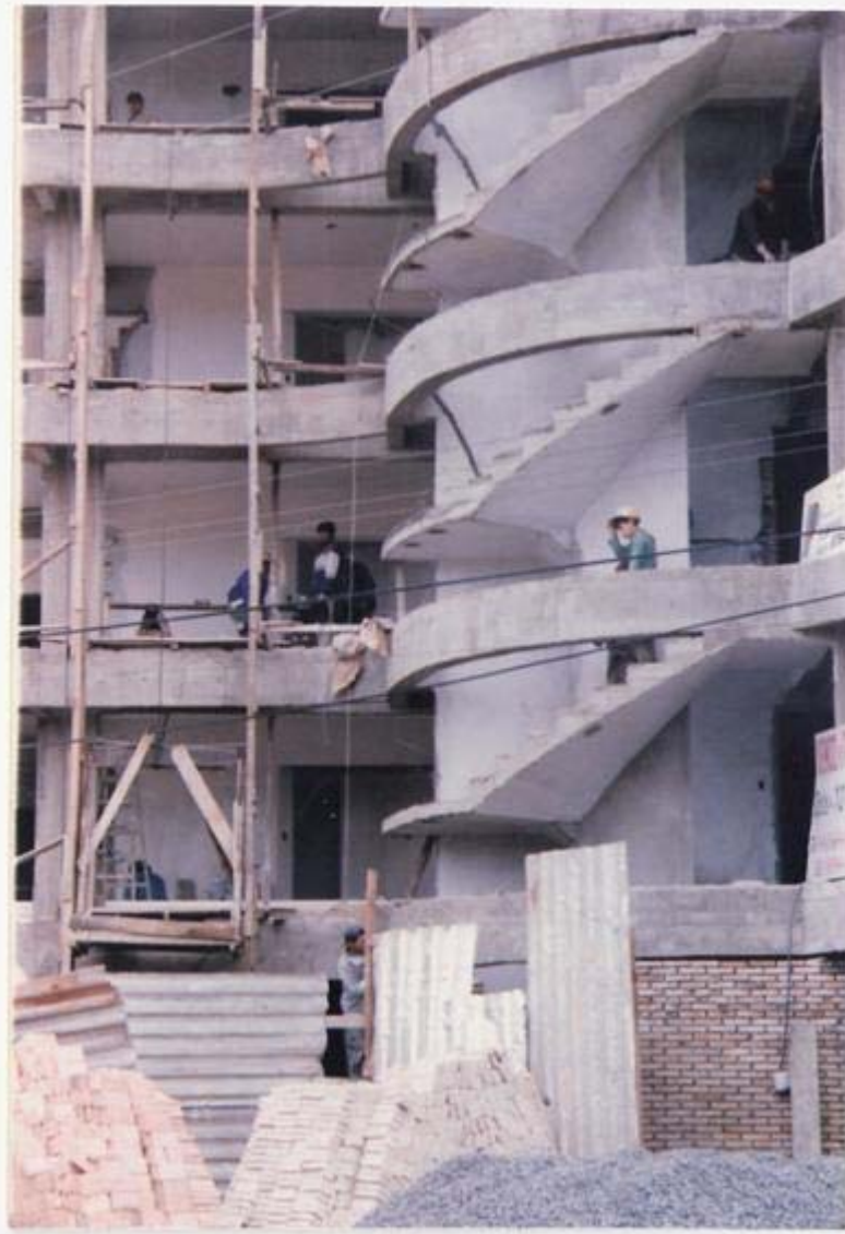
EDIFICIO ALICANTE II 14 de Mayo y 5ta.