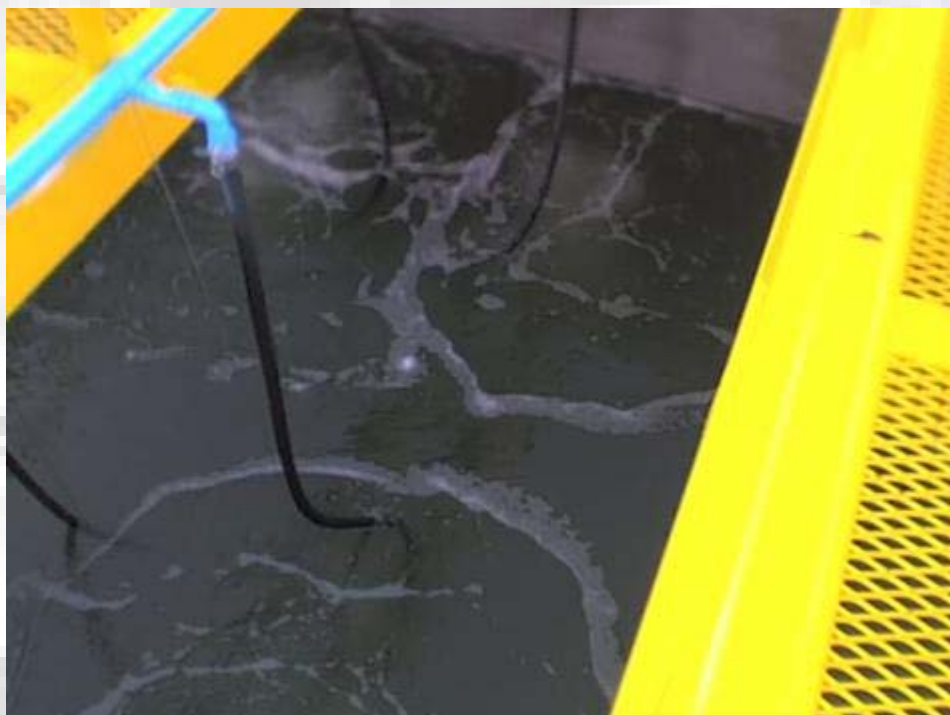
Chortitzer Komitee Puesta en Marcha Difusores de Aire