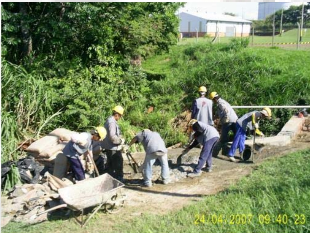
Petrobras Terpar Reparación de puente de acceso Desagüe Pluvial