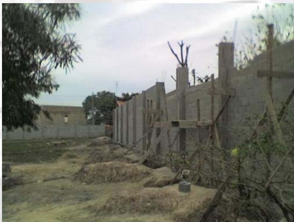
Monte Alegre S.A. Muros divisorios – Mariano Roque Alonso