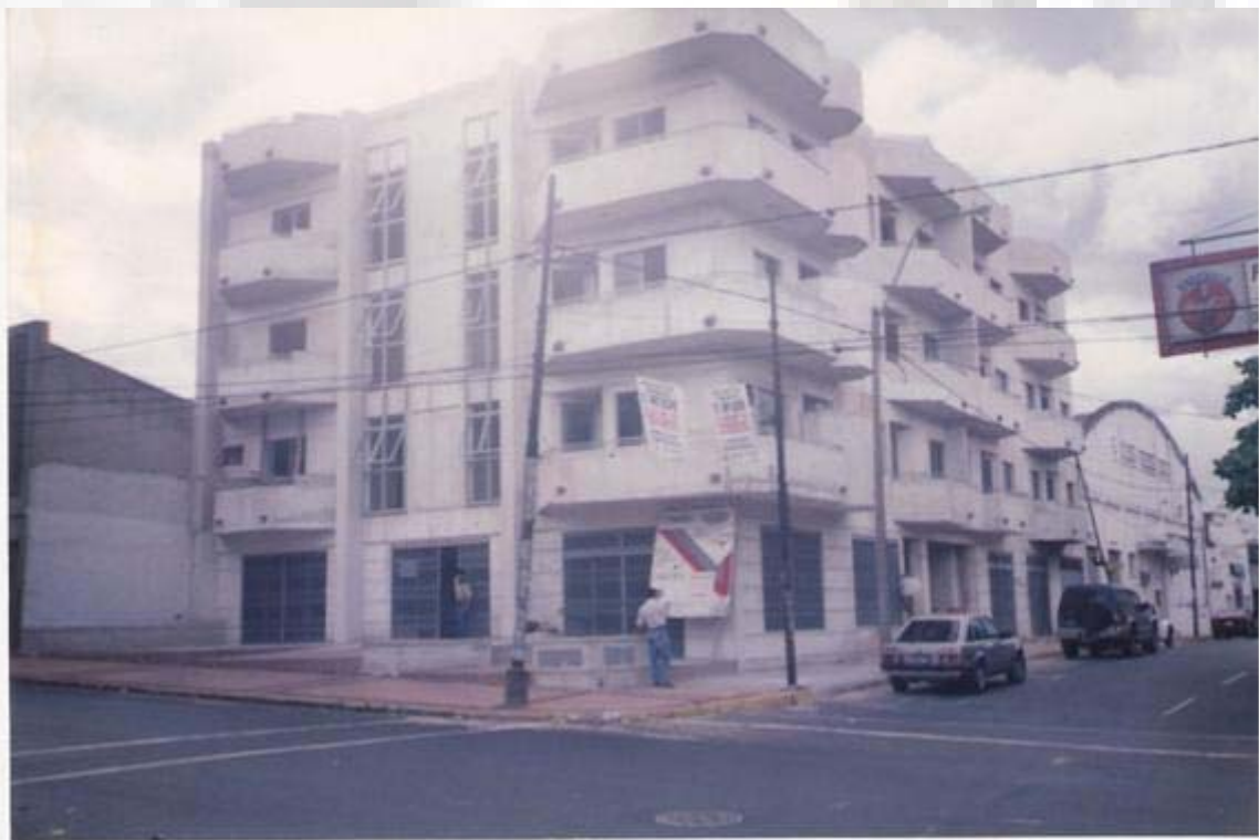
Edificio Florentina Colón Esq. Manduvirá