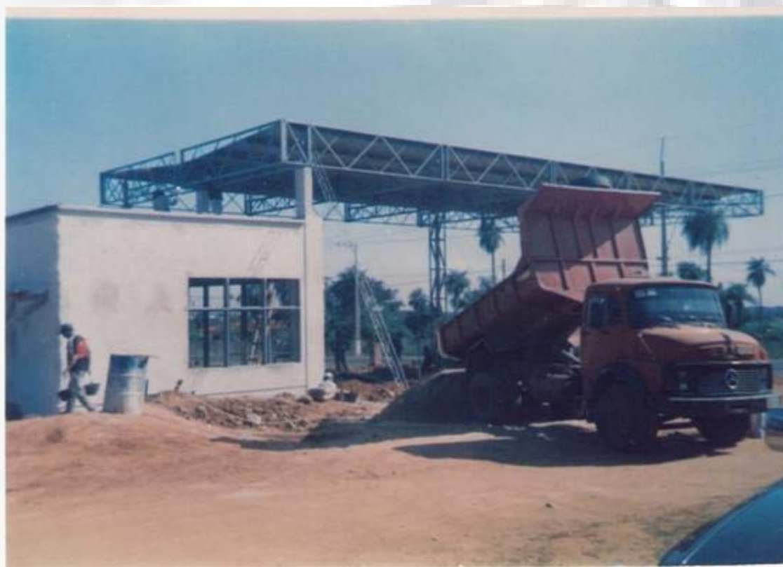
Estación de Servicio Integral Guarambaré