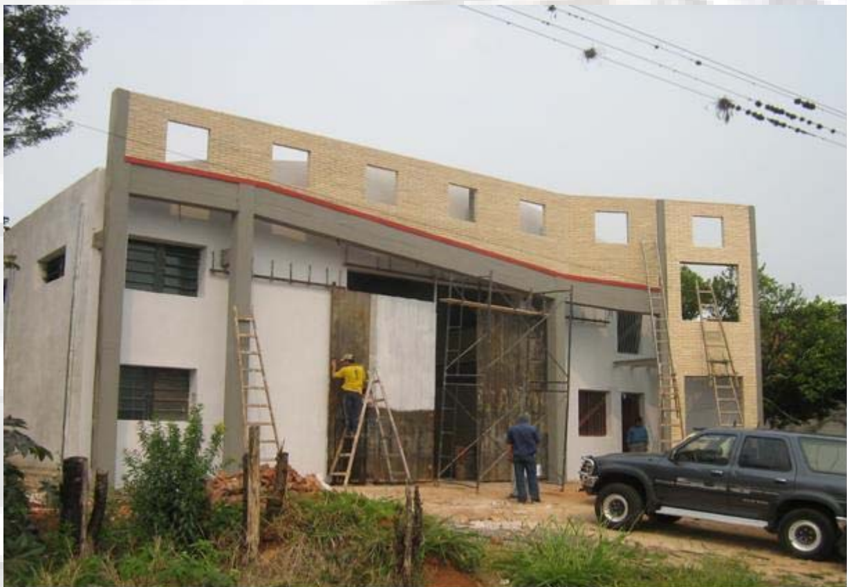
Oficinas y Depósito Alquímica S.A. – Capiatá