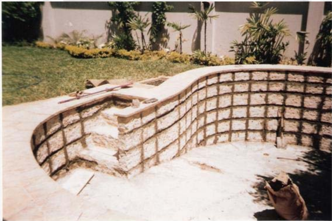
Trabajos de Reparación Filtraciones en piscina