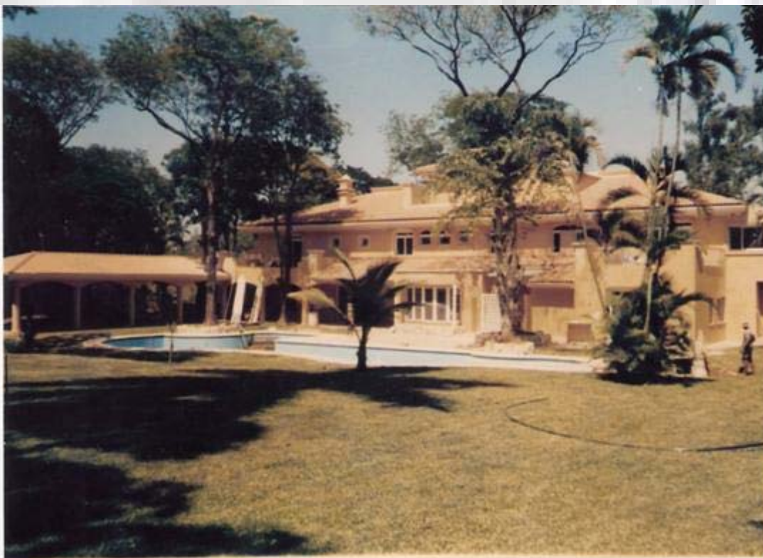
Vivienda Flía. Kontner