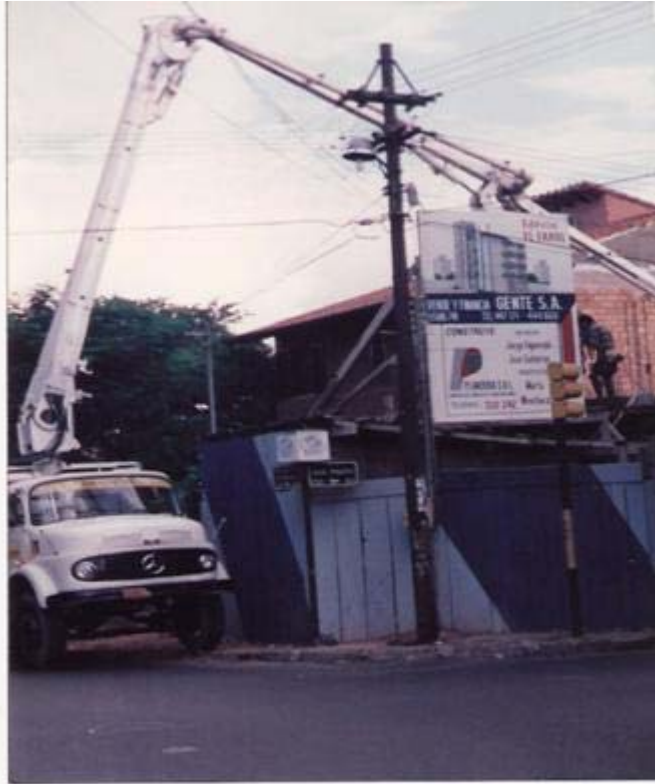
Edificio El Farol Luis A. Herrera y Gral. Aquino