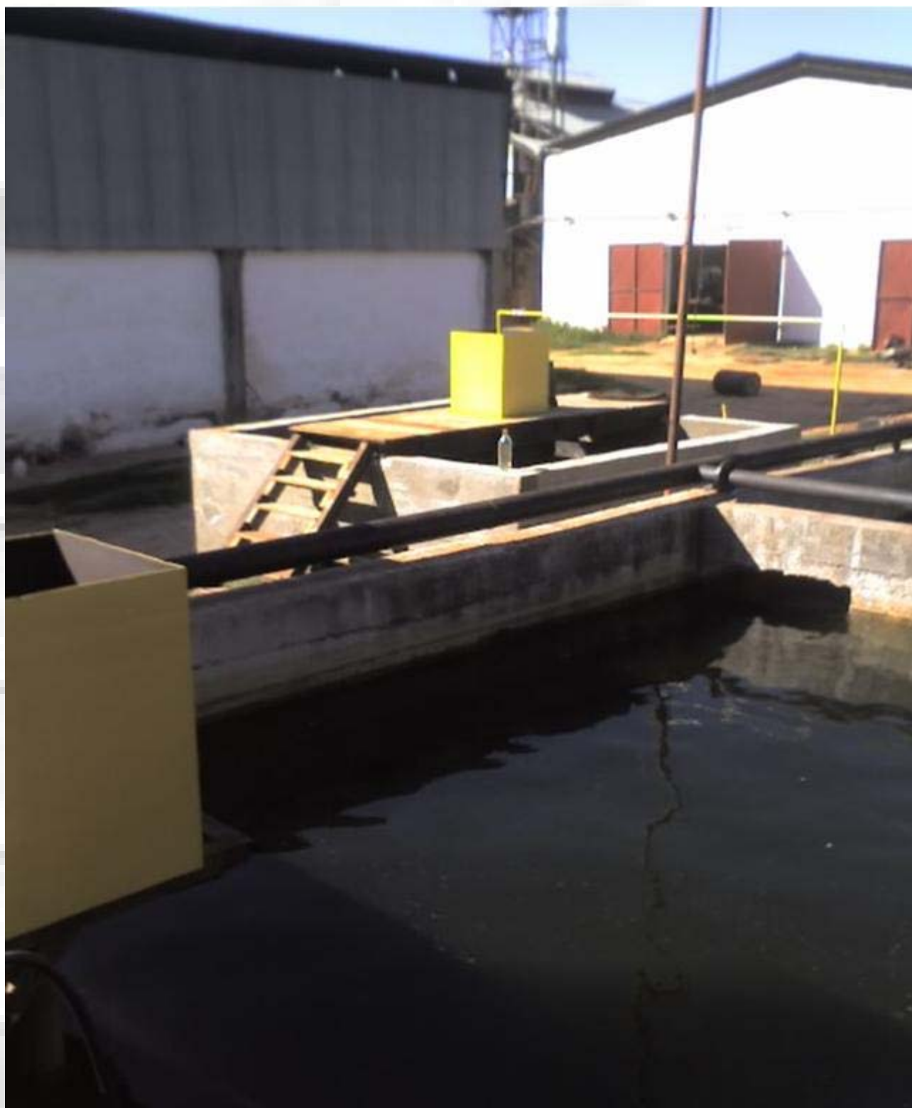
ACEITERA Y JABONERIA INDHOR Planta de Tratamientos de Efluentes