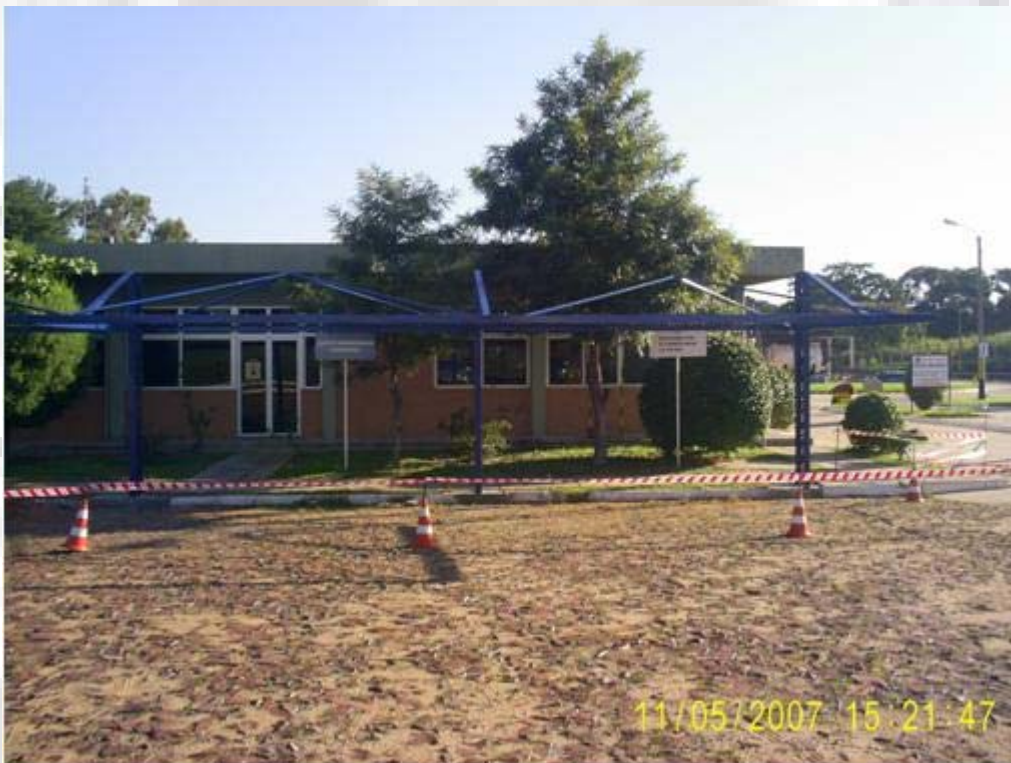
Petrobras Terpar Arriba: reparación subestación - Abajo: Estructura metálica estacionamiento.