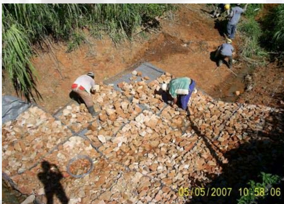
Petrobras Terpar Colocación de colchones renno en lecho de arroyo