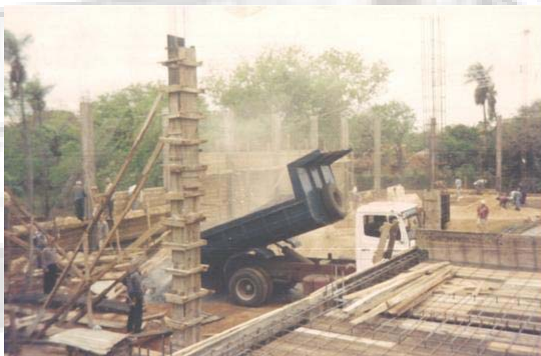
Depósitos y Oficinas Sadia – Montana S.A. Fernando de la Mora