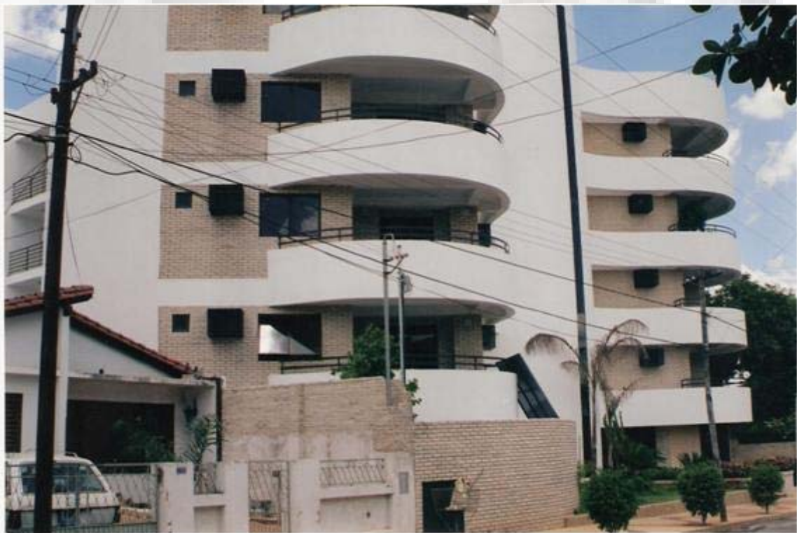
Edificio Alicante II 14 de Mayo y 5ta.