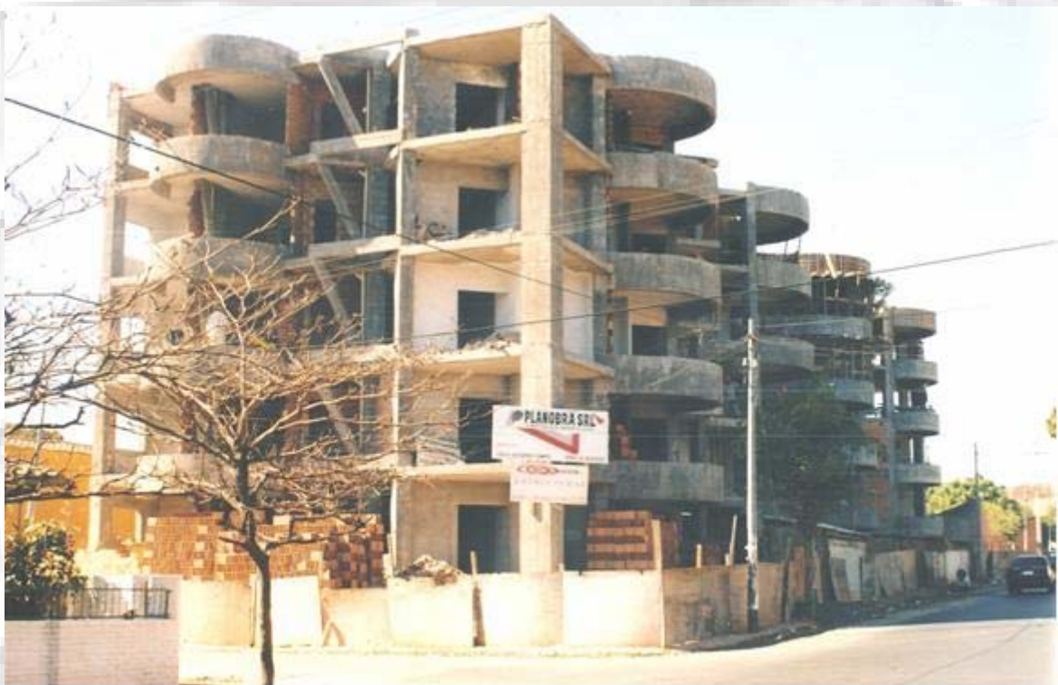
Edificio Alicante III De las Palmeras y Cruz del Chaco