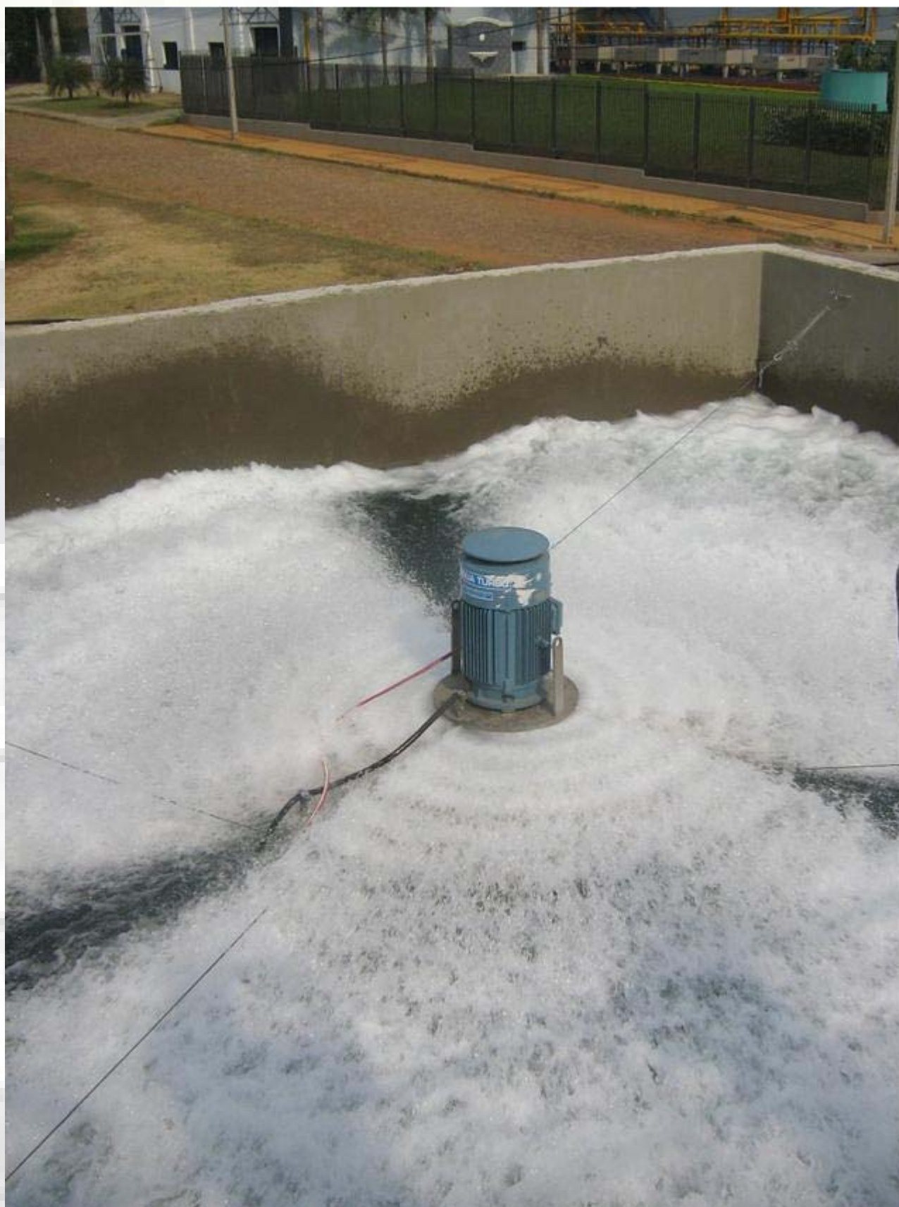
Salemma Planta de Tratamiento de Efluentes Aireador flotador en funcionamiento