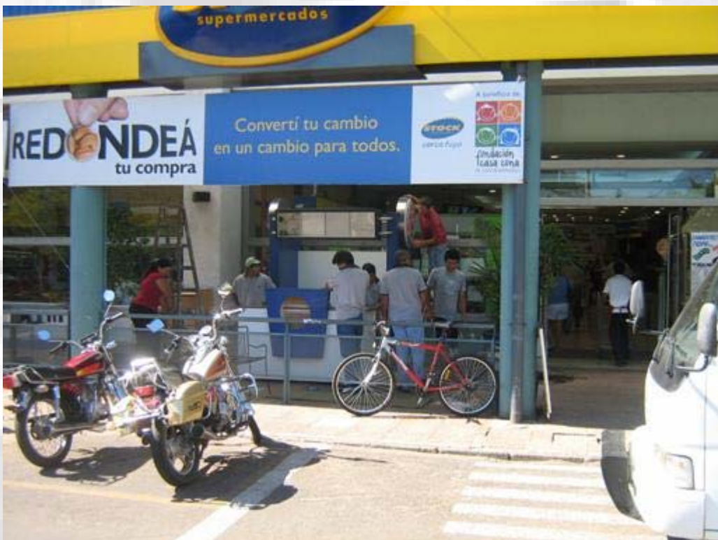
BURGERKING Kiosco Shopping del Sol