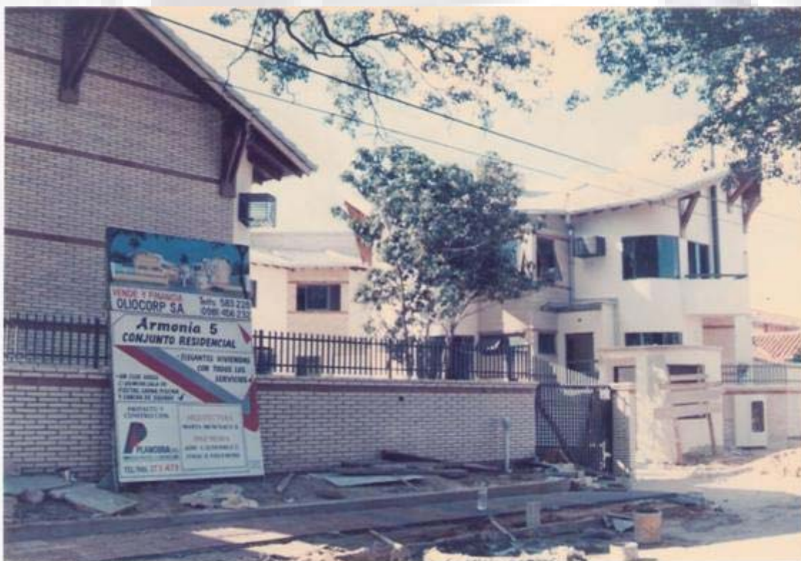
Conjunto Habitacional Villa Morra