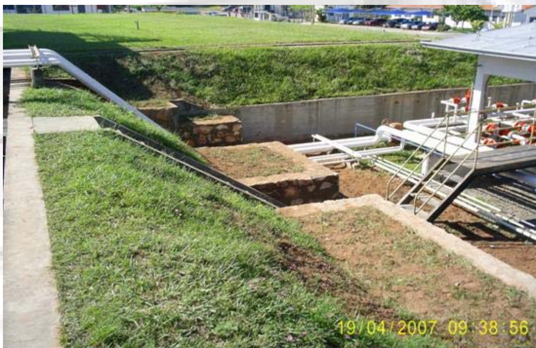
Petrobras Gas Villa Elisa Construcción muro contención de talud