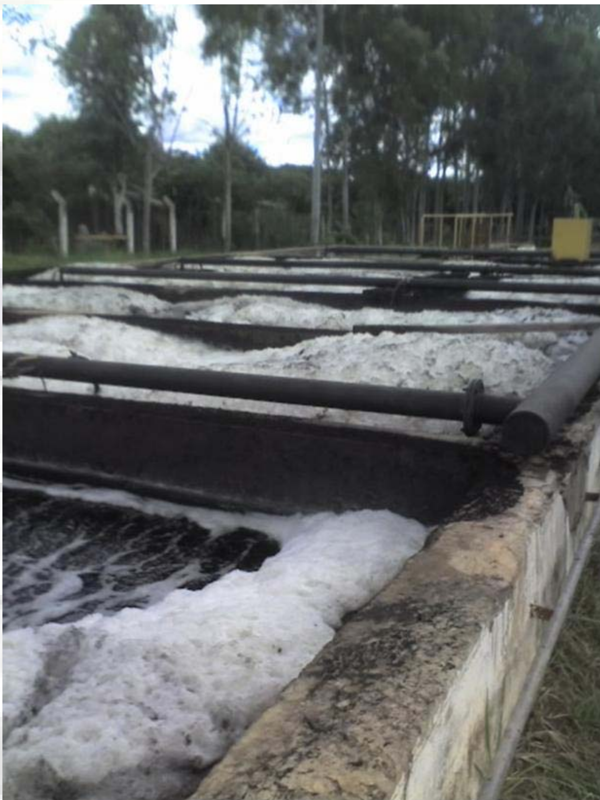
ACEITERA Y JABONERIA INDHOR Planta de Tratamientos de Efluentes Industriales