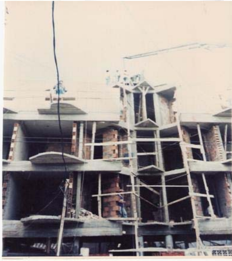
Edificio Don Gabriel Río de La Plata y Dr. Massei